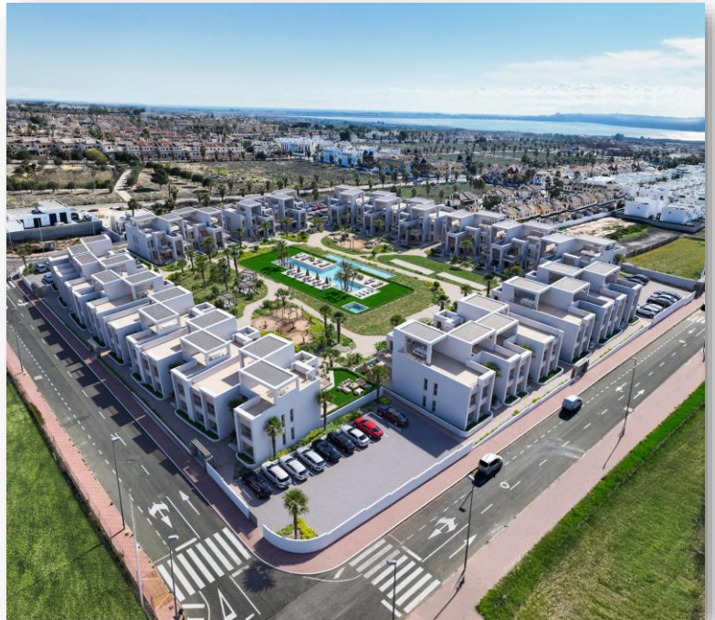
AREAbeach V Lo Marabú